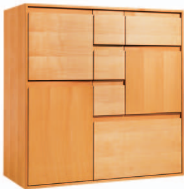
MODELL TUERI 300/206 100/100/45 CM