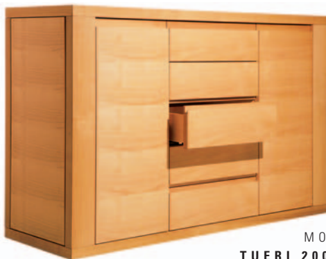
MODELL TUERI 200/205 140/90/450 CM