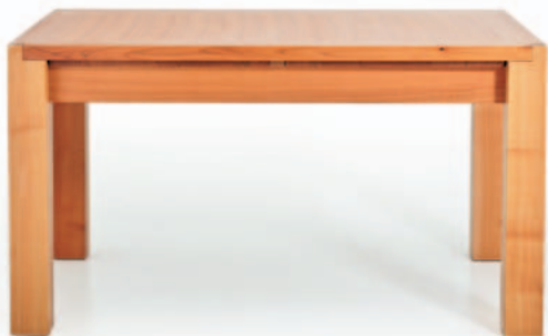
MODELL TUERI 500/000 90/140/75 CM