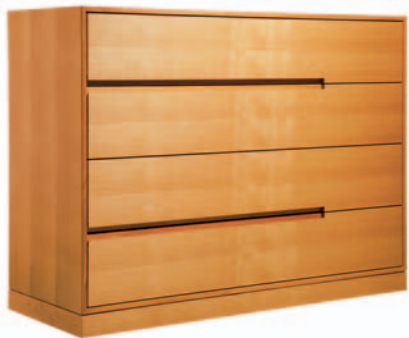
MODELL TUERI 300/004 120/90/45 CM